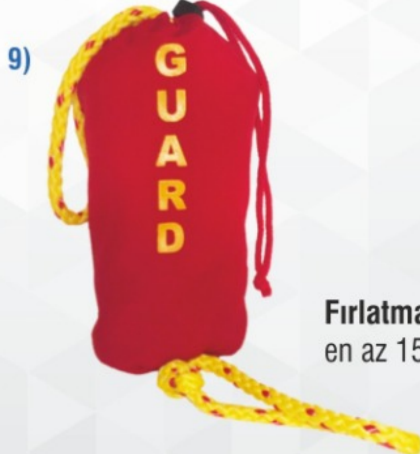
Fırlatma ipi (Torba içinde toplanabilen en az 15 m. uzunluğunda yüzer ip)