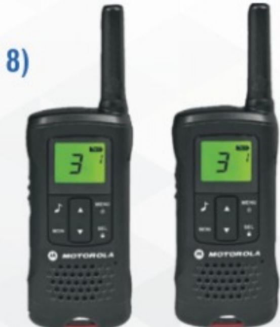
Telsiz (Her cankurtaran için 1 adet telsiz - PMR)