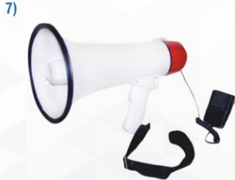
Megafon (Kalabalıkta rahat duyuru yapılabilecek güçte, sireni bulunan)