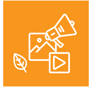
Medya ve Çevre Eğitimi