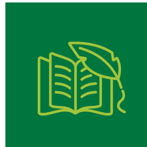
Edebiyatın Çevre Eğitimindeki Rolü