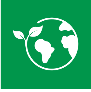
Çevre Eğitiminde Uluslararası Yaklaşımlar