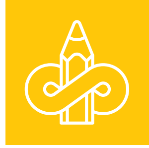
Yetişkinler için Çevre Eğitimi- Yaşam Boyu Öğrenme