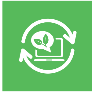
Sürdürülebilir Gelecek için Yeni Teknolojiler