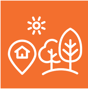
Yerel Yönetimler ve Çevre Eğitimi