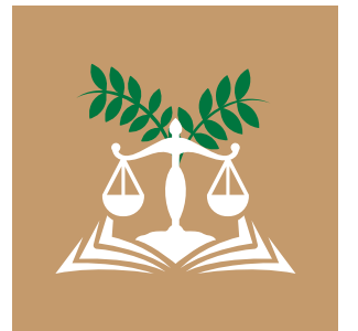
Çevre Felsefesi, Etiği ve Hukuku