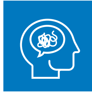
Eko-anksiyetenin Eğitim Çalışmalarına Etkisi