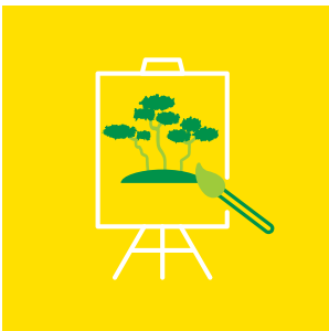
Sanat ve Kültürün Çevre Eğitimindeki Rolü