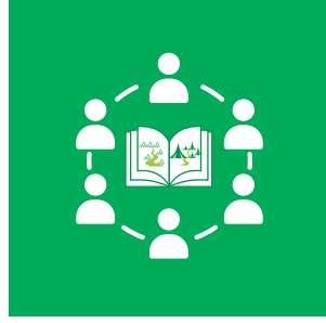
Toplumda Çevre Okuryazarlığı