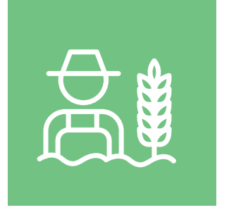
Çevre Eğitiminin Yaygınlaştırılması