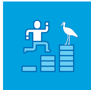
Başarının Ölçülmesi: Çevre Eğitimi Programlarının Etkinliğinin Değerlendirilmesi