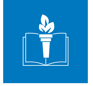
Yükseköğretimde Çevre ve Sürdürülebilirlik Eğitimi