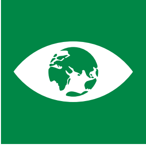
İklim Değişikliği ve Uyum Eğitimi